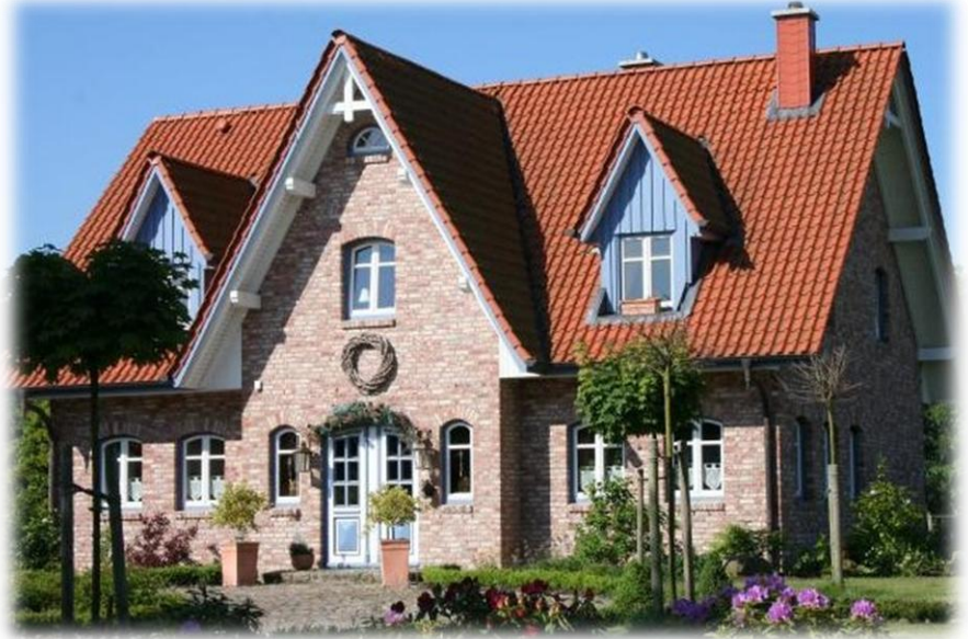
“ Abbildung enthält Zusatzleistungen “